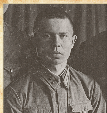
Николай Иванович Макаров 1922–1972