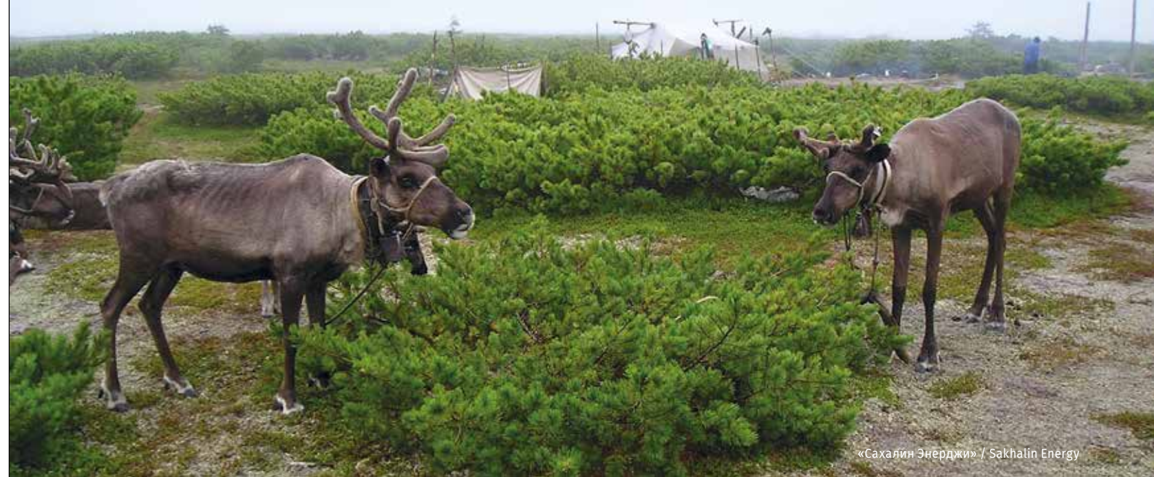
«Сахалин Энерджи» / Sakhalin Energy

полузабытые огородные культуры, по торговым путям продукты земледелия могли попасть в островной мир. Единственная тонкая ниточка, позволяющая надеяться, что данное предположение не фантазия ученых, — это кариес зубов