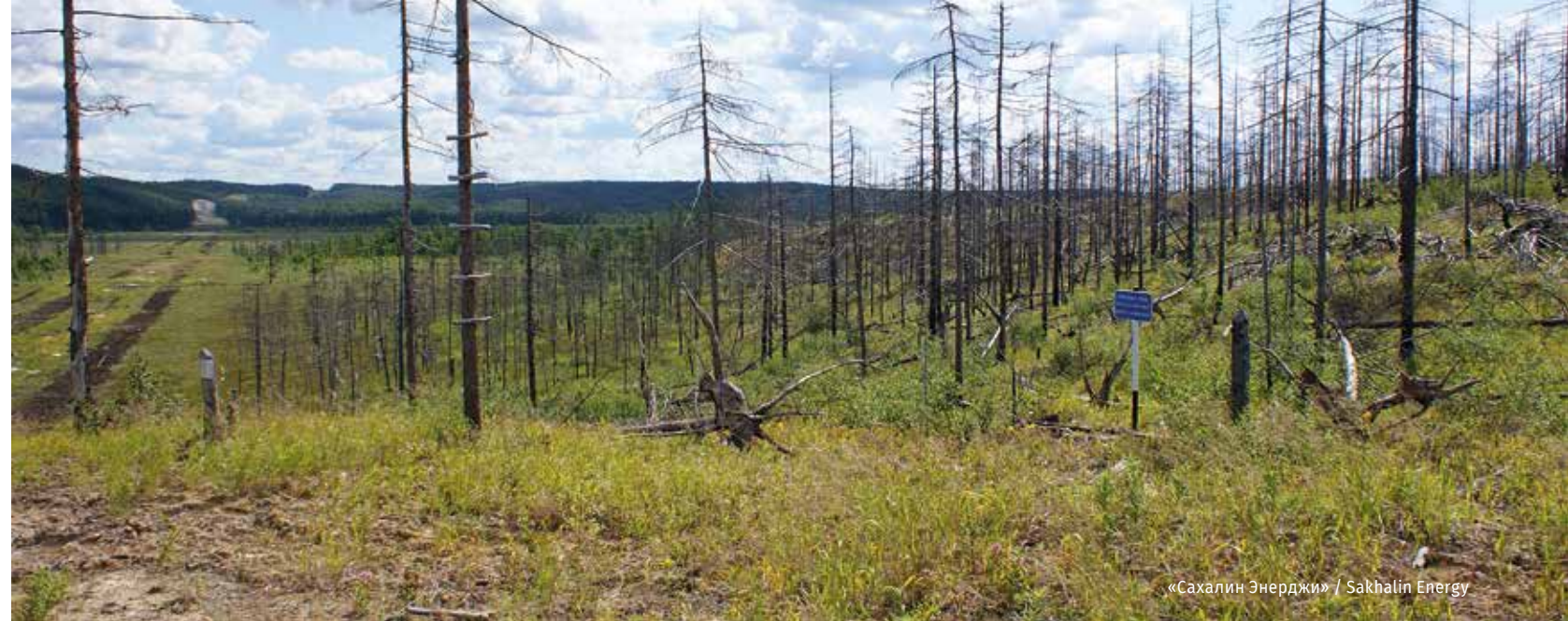
«Сахалин Энерджи» / Sakhalin Energy

В целях защиты находок, которые не могут быть перемещены в музейные фонды, в 2009 году на границах пересечения территории памятников и полосы землеотвода производственных объектов были установлены информационные плакаты. Начиная с 2009 года, с момента вступления проекта в полномасштабную фазу эксплуатации, археологический мониторинг проводится ежегодно. В ходе его осуществления ландшафтные участки древних поселений и стоянок осматриваются с целью недопущения нарушений антропогенного или естественного характера. В случае обнаружения повреждений