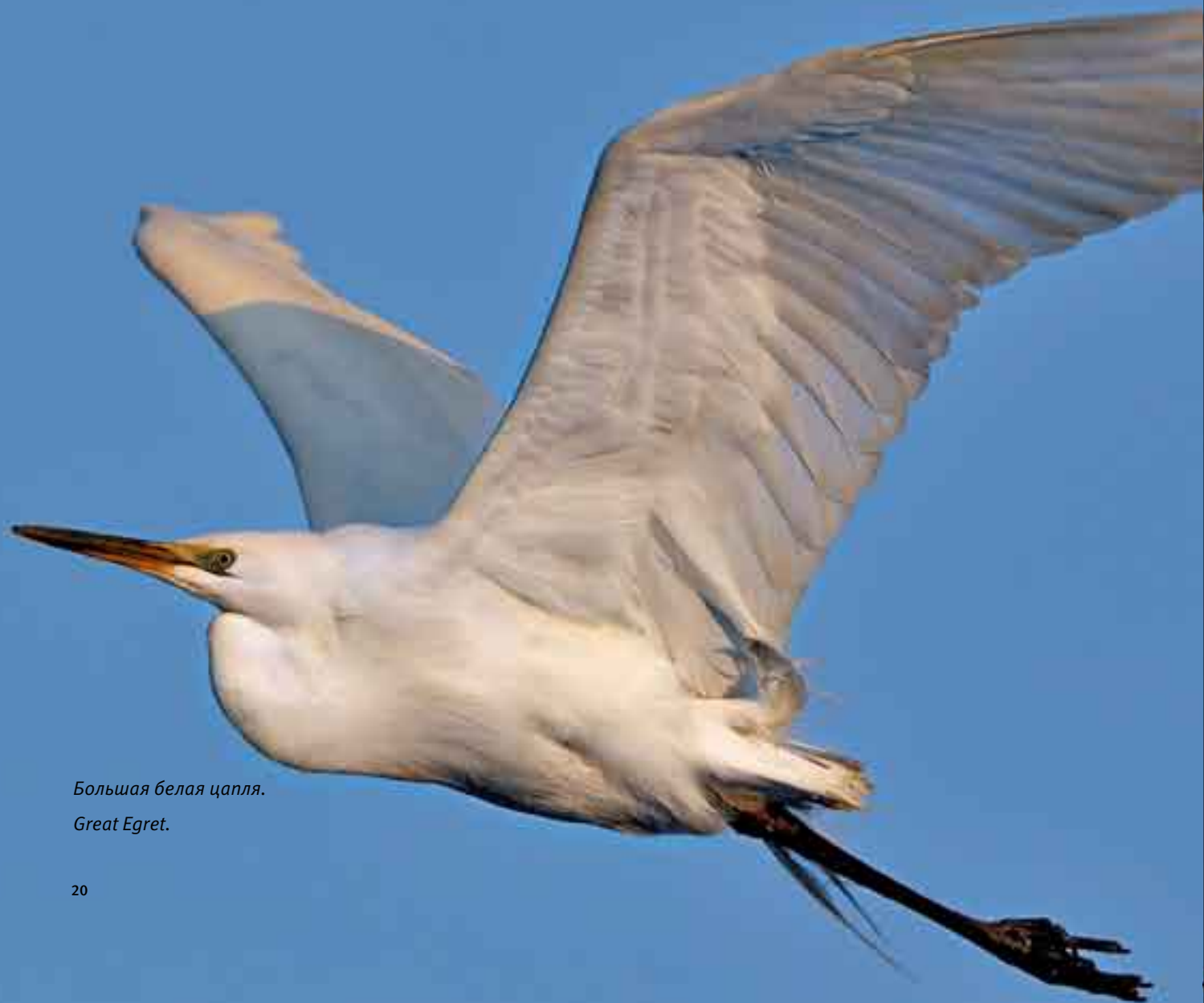
Большая белая цапля.