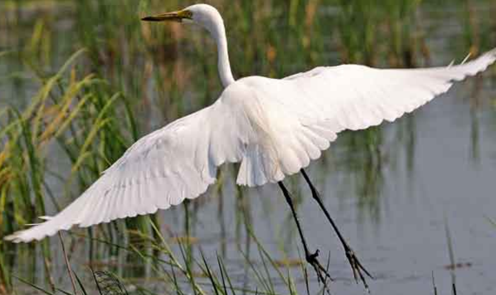
Средняя белая цапля. Intermediate Egret.