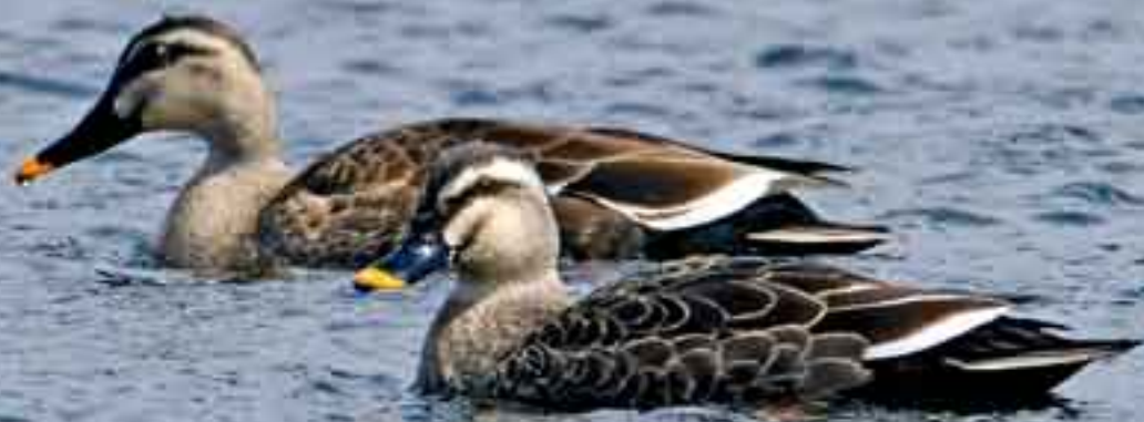
Черная кряква. Spot-billed duck.