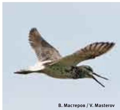
B. Матрепов / V. Masterov

Sakhalin Energy organised environmental studies along the pipeline right-of-way, including an inventory of avian diversity on future construction sites and monitoring the status of avian fauna during construction. Unfortunately, no sightings of spotted greenshanks breeding were recorded in the areas under study.